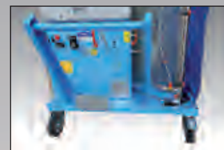
maniglione con comandi controls handle