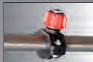
ugello aspersione acqua water sprinkler nozzle

Water tank 300 litres, tilting brush, hydraulic traction, dual controls, brush diameter 1.000 mm.