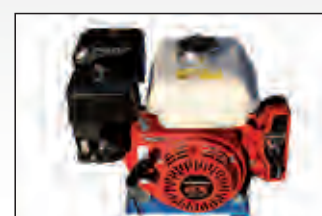
gruppo motore Honda Honda motor unit