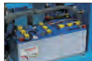
gruppo batteria 24V 24V battery pack