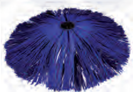
spazzola mista polietilene carlite mixed brush

The brush, made of high density soft material allows a thorough cleaning of large surfaces in a short space of time. Also available with carlite or mixed brush (optional).