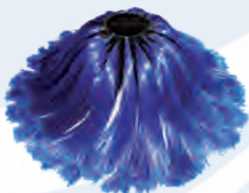
spazzola in polietilene alta densità high density polyethylene brush

EASYWASH 300 is equipped with a tilting facility, therefore the brush always perfectly fits the surface to be cleaned.