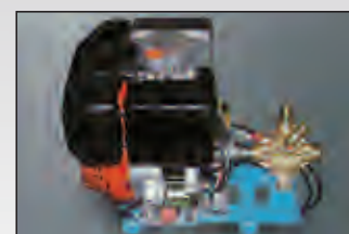
gruppo motore diesel diesel engine unit