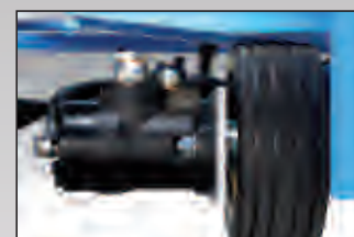
ruota trazione traction wheel