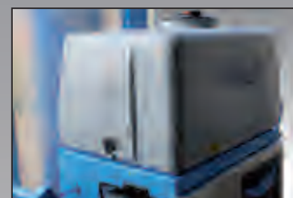
serbatoio acqua water tank